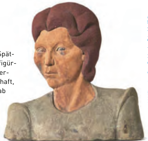
Nachlass: Peter László Péri/Sammlung Peter Peri, London. Foto: Jake Walters © Für die Werke von Peter László Péri: Nachlass: Peter László Péri | Peter László Péri Estate, London

Im Zentrum dieser Ausstellung steht das in England entstandene Spätwerk des ungarischen Bildhauers Peter László Péri. Vornehmlich figürlich und in Zement gestaltet, spiegeln seine Arbeiten das große Interesse des Künstlers an Menschen sowie seine Ideale von Gemeinschaft, Menschenwürde und Solidarität wider. 1933 emigrierte Péri – der ab 1920 in Deutschland arbeitete – nach London und schuf Werke, in denen er sehr frei mit Maßstab, Motiv und Perspektive sowie dem Widerspruch zwischen flachem Bild und realem Volumen umging. Zu sehen Am Wall 208, Tel. 0421-989 75 20. www.marcks.de