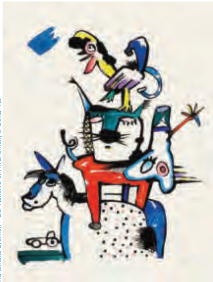
Otmar Alt, Bremer Stadtmusikanten, 1985, Farbserigraphie, aquarelliert, 34, Kunsthalle Bremen – Der Kunstverein in Bremen, © Otmar Alt

Genau. Ein bisschen Wildheit schlummert in uns allen. Bringen Neugeborene sie noch ungebändigt zum Ausdruck, nimmt ihre Intensität mit dem sozialen Lernen ab. Und doch begleitet uns das Wilde ein Leben lang – im Miteinander, in unserem Inneren, in der Natur und in der bildenden Kunst. Vier spannende Aspekte, die sich in den über 100 historischen wie zeitgenössischen Werken und Installationen dieser Ausstellung widerspiegeln und auf Entdeckung warten. Kind- und familiengerecht inszeniert, decken sie vielfältige Bezüge zwischen wilder Kunst und aktuellen Lebensrealitäten von kleinen und großen Menschen auf. Mitmachangebote, Suchspiele, Tastobjekte und mehr bereichern die Schau in der Kunsthalle Bremen, Am Wall 207, 28195 Bremen, Tel. 0421-32 90 80. www.kunsthalle-bremen.de