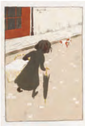
Pierre Bonnard, Kleine Wäscherin, 1896, Lithographie, Kunsthalle Bremen – Der Kunstverein in Bremen

Kinder – Träume – Tiere – Kunst in der Kunsthalle Bremen bis 14. Juli