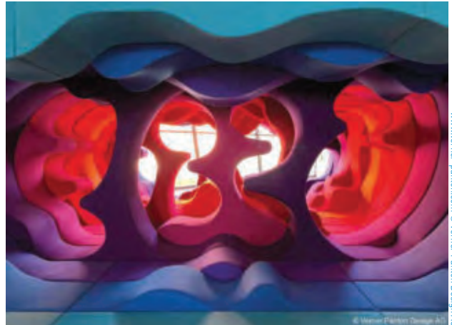
Verner Panton, Fantasy Landscape, limited edition 2/8, Design by Verner Panton, www.verner-panton.com © Verner Panton Design AG