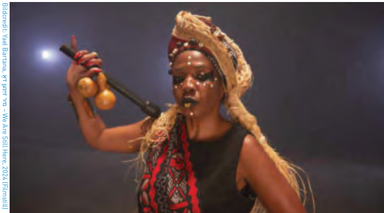
Bildcredit: Yael Bartana, © Jupp 79 - We Are Still Here, 2024, Filmstill

Yael Bartana. Utopia Now! in der Weserburg, 25. Mai bis 24. November