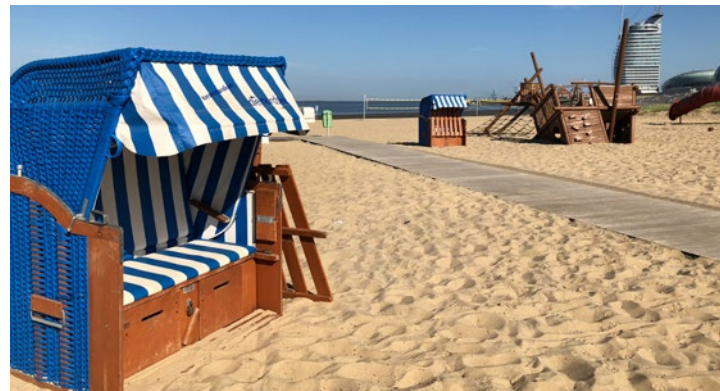
Stand Juli 2019. Keine Haftung für Satz- und Druckfehler.