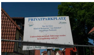
Beschilderung des Parkplatzes