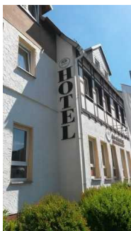
Hotel & Restaurant Am Jüdenhof