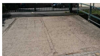
Steigung zum Parkplatz