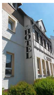
Hotel & Restaurant Am Jüdenhof