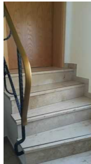
Treppe zum Gäste-WC