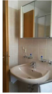
Waschbecken und Spiegel