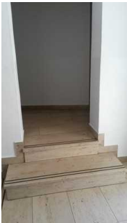
Stufen zum Flur

Über den Flur / Weg / Durchgang sind zu erreichen: Separate Gästetoilette