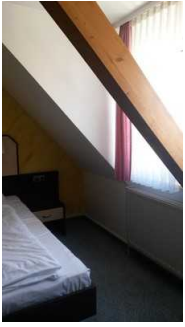
Dachschräge neben dem Bett