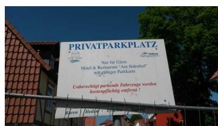
Beschilderung des Parkplatzes