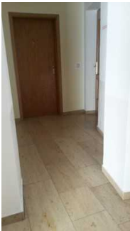
Flur zum Gäste-WC