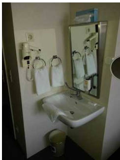
Waschbecken im Zimmer nicht im Sanitärraum