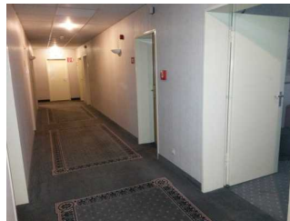
Weg vom Aufzug zum Zimmer

Über den Flur / Weg / Durchgang sind zu erreichen: Rezeption , Frühstücksraum und Restaurant , Zimmer 138