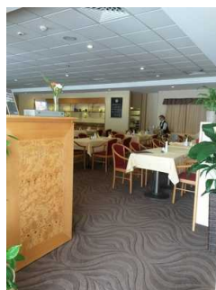
Engste Stelle im Restaurant am Counter