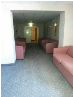
Weg vom Aufzug zum Zimmer