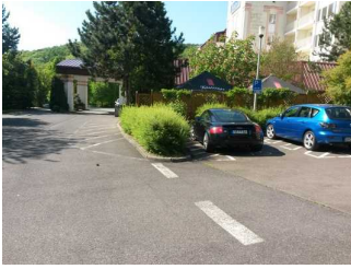
Weg vom Parkplatz zum Haupteingang