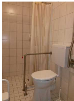
Dusche und Toilette