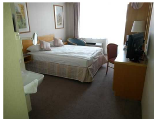
Blick ins Zimmer