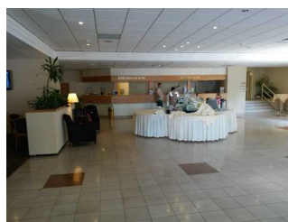
Lobby vor der Bar und der Rezeption