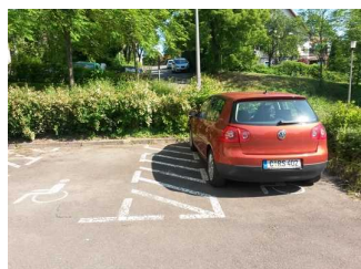
Parkplatz 1 und 2