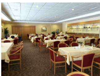
Blick ins Restaurant