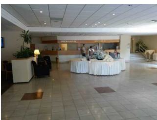
Lobby und Rezeption