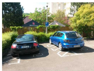
Parkplatz 3 und 4