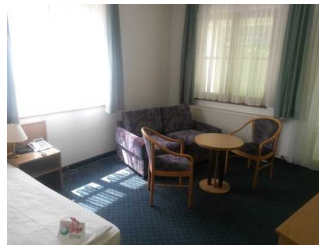
Sitzgruppe im Zimmer