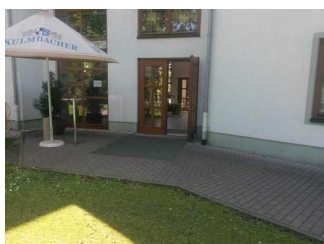
Blick vom Parkplatz auf den Eingang