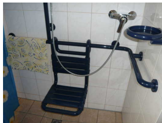
Dusche inkl. Duschstuhl