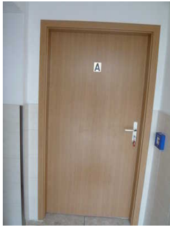
Schlafraum Zimmer A