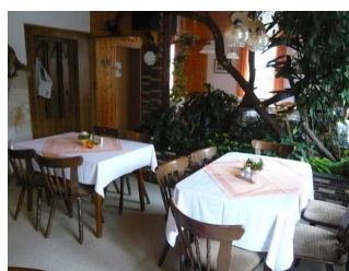
Tische im Gasträum

Es gibt Tische mit heller und blendfreier Beleuchtung.