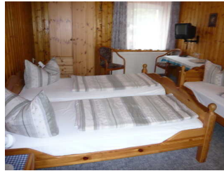
Doppelbett Zimmer A