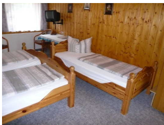
Zustellbett Zimmer A