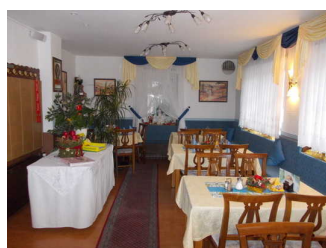
Gastraum des Restaurants