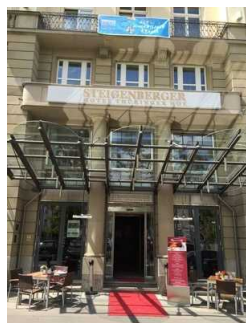
Steigenberger Hotel Thüringer Hof