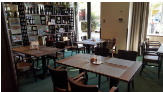
Teilbereich des Restaurants