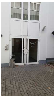
Tür zum Nebeneingang