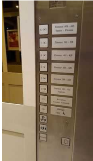
Bedienfeld des Aufzugs

Die Bedienelemente bzw. die Beschilderung sind weder bildhaft noch (im Falle eines entsprechenden Leitsystems) farblich gekennzeichnet.