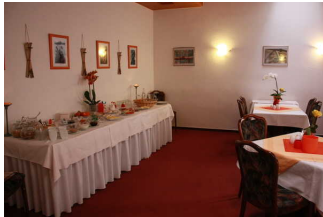
Blick auf das Buffet