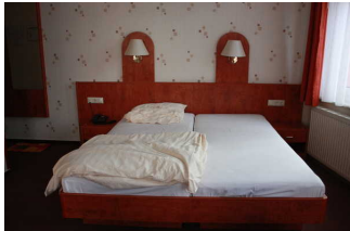
Blick auf das Bett im Zimmer