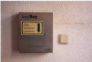
Blick auf den keyBoy- Schlüsselautomaten

Über den Flur / Weg / Durchgang sind zu erreichen: Rezeption , Zimmer Nr. 13 (1. OG)