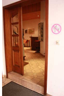
Flur von der Stufe zur Rezeption