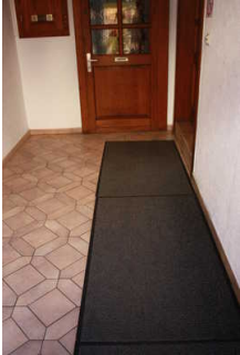
Flur vom Eingang zur Stufe (rechts)