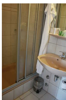
Blick auf das Waschbecken und die Dusche