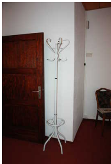
Garderobenständer im Eingangsbereich