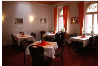
Blick in den Frühstücksraum