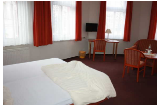
Blick in das Zimmer