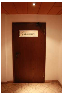
Tür zum Gastraum