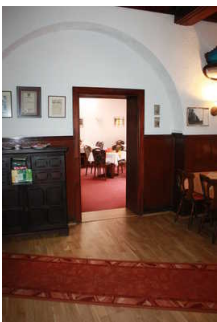
Weg durch den Gastraum zum Frühstücksraum

Über den Flur / Weg / Durchgang sind zu erreichen: Rezeption , Frühstücksraum / Restaurant