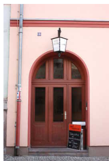
Blick auf den Hoteleingang

Eingangsbereich hell und blendfrei ausgeleuchtet.