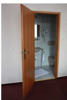
Blick in das Badezimmer