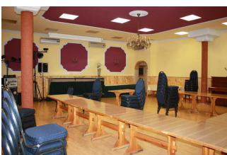
Blick in den Konferenzraum