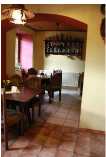
Blick in das Restaurant