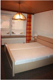
Blick in das Zimmer