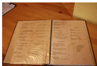
Blick in die Speisekarte