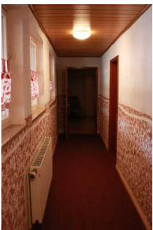
Flur zu den Zimmern