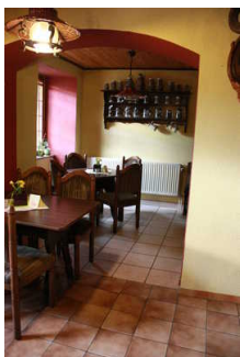
Blick in das Restaurant