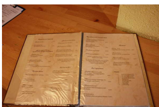
Blick in die Speisekarte