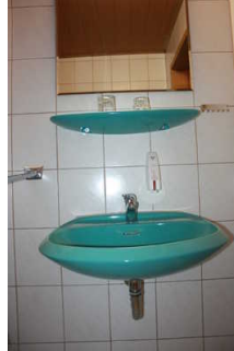
Blick auf das Waschbecken mit Spiegel