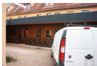
Parkplatz im Hof