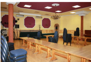
Blick in den Konferenzraum