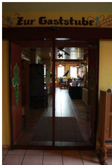
Tür zum Restaurant

Tür gehört zu: Weg vom Eingang zur Rezeption und zum Restaurant, Frühstücksraum und Restaurant