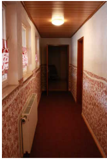
Flur zu den Zimmern

Über den Flur / Weg / Durchgang sind zu erreichen: Zimmer Nr. 3