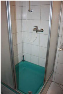
Blick in die Duschkabine