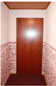
Tür zu Zimmer Nr. 3