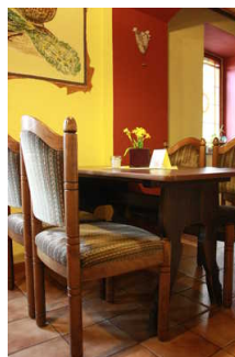
Tisch mit Sitzplätzen im Restaurant