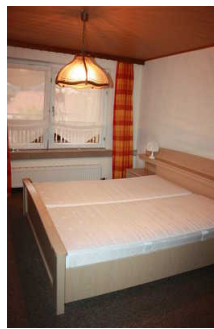
Blick in das Zimmer