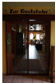
Weg zur Rezeption hinter Glastür

Über den Flur / Weg / Durchgang sind zu erreichen: Rezeption / Anmeldung , Frühstücksraum und Restaurant