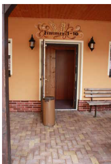
Tür zum Flur zu den Zimmern