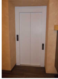
Einstieg im Erdgeschoss