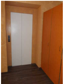
Ausstieg in der 2. Etage

Über den Aufzug sind zu erreichen: Zimmer 20 in der 2. Etage