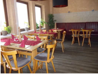
Sitzbereich im Ersatzrestaurant