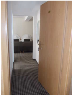
Zugang zum Zimmer