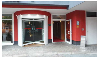
Drehtür und Nebeneingang