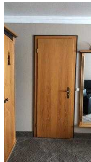
Blick auf Tür vom Zimmer aus