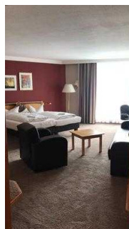
Blick ins Zimmer 101