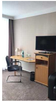
Schreibtisch und TV im Zimmer 101