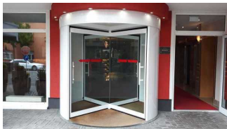
Drehtür und Nebeneingang