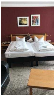
Doppelbett in Zimmer 101