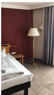
Platz rechts vom Bett