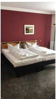
Bett im Zimmer 201

Durch die Kofferablage neben der Tür ist der Eingang zugleich die schmalste Stelle im Zimmer.