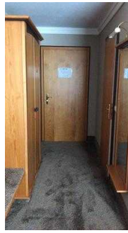
Blick auf die Tür. Links steht der Kleiderschrank, rechts die Tür zum Bad.