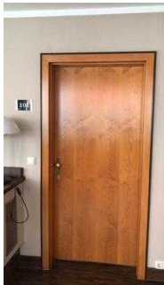
Tür Zimmer 101