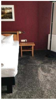
Platz rechts neben dem Bett