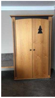
Kleiderschrank mit Platz davor