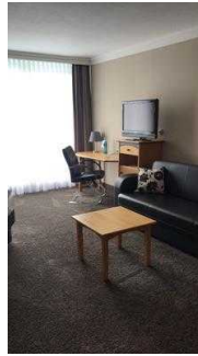
Schreibtisch, TV und Couch in Zimmer 201