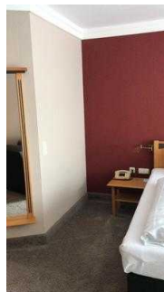
Platz links vom Bett