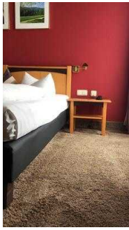
Platz rechts neben dem Bett