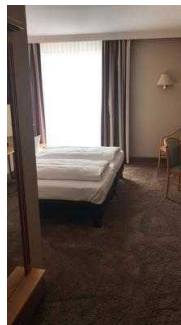
Blick ins Zimmer 105