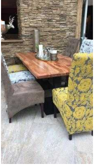
Plätze im Wintergarten des Restaurants