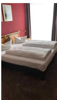
Bett im Zimmer 105