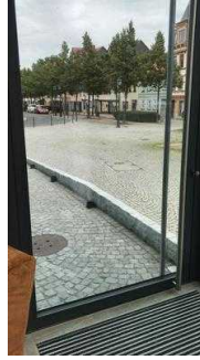
Außentür zum Restaurant (über Rampe erreichbar)

Es gibt Tische mit heller und blendfreier Beleuchtung.