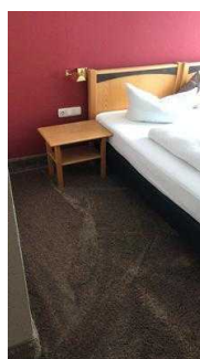
Platz links neben dem Bett