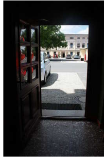
Haupteingang von innen mit Rezeption

Name und Logo des Betriebes/der Einrichtung sind von außen klar erkennbar.