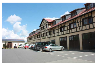
Parkplatz am Gästehaus

Es ist ein allgemeiner Parkplatz vorhanden.