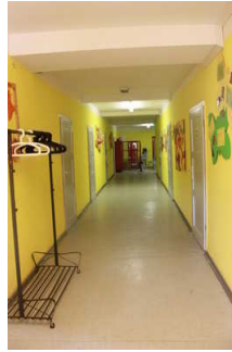
Flur ab Rezeption