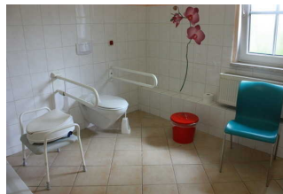
WC mit Haltegriffen