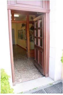
Haupteingang mit Rezeption