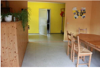
Weg im Seitengebäude