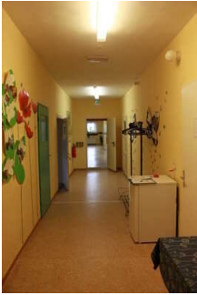
Flur zu Zimmer205