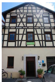
Gästehaus Papilio in Ranis