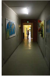
Weg ab Rezeption zum Speiseraum

Über den Flur / Weg / Durchgang sind zu erreichen: Eingangsbereich Seitengebäude , Rezeption 1.Etage , Speiseraum 1.Etage , Schlafraum Zimmer 205 - 1.Etage , Information und Rezeption 1.Etage