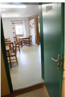
Tür zum Speiseraum