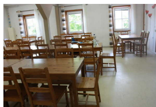
Speiseraum im Gästehaus 1.Etage