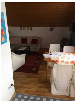
Blick auf die Sitzgruppe im Wohnraum

Zugang zum Raum über: Treppe zur Ferienwohnung , Schwelle oberhalb der Treppe zur Ferienwohnung