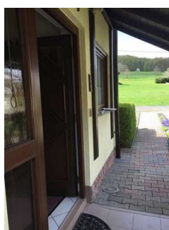
Blick auf die Tür und Weg zum Eingang