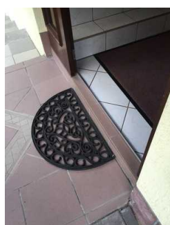
Blick auf die Eingangsschwelle