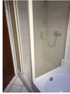
Blick in die Duschkabine