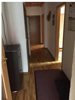
Blick in den Flur

Über den Flur / Weg / Durchgang sind zu erreichen: Elternschlafzimmer , Bad in der Ferienwohnung , Wohnraum , Küchenzeile im Wohnraum