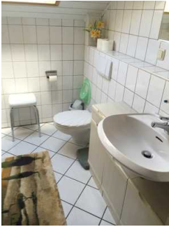
Blick auf Waschbecken und Toilette

Der Sanitärraum gehört zu: Elternschlafzimmer