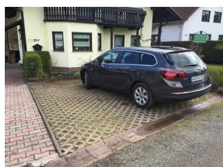
Blick auf den Parkplatz