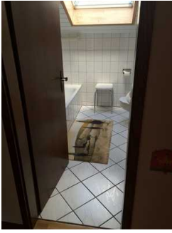
Blick in das Bad