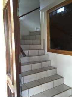
Blick auf die Treppe

Über die Schwelle / Stufe / Treppe sind zu erreichen: Elternschlafzimmer , Bad in der Ferienwohnung , Wohnraum , Küchenzeile im Wohnraum , Flur zur Ferienwohnung