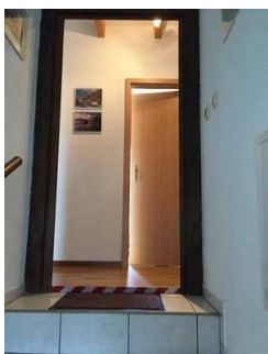
Blick auf die Schwelle zur Ferienwohnung