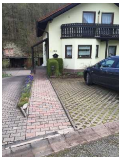
Blick auf den Weg zum Eingang

Über den Weg sind zu erreichen: Haupteingang