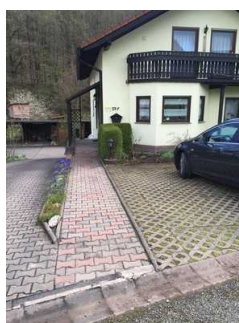
Blick auf den Parkplatz und Weg

Es ist ein allgemeiner Parkplatz vorhanden.