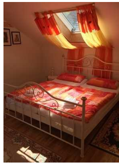
Blick auf das Bett

Zugang zum Schlafraum über: Treppe zur Ferienwohnung , Schwelle oberhalb der Treppe zur Ferienwohnung