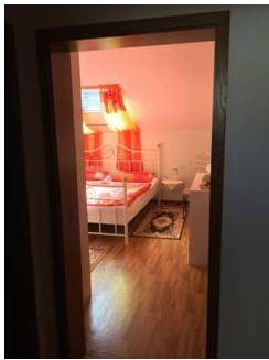
Blick in den Schlafraum