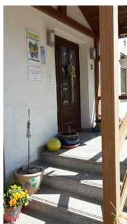
Blick auf den Eingang