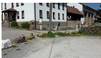
Blick auf den Parkplatz

Es ist ein allgemeiner Parkplatz vorhanden.