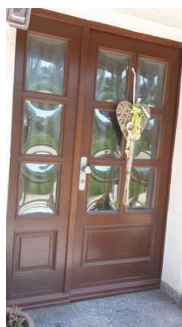
Blick auf die Eingangstür

Name und Logo des Betriebes/der Einrichtung sind von außen klar erkennbar.