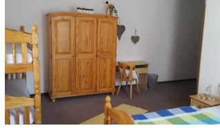
Blick zum Eingang des Zimmers