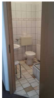
Blick ins Badezimmer

Es ist kein Alarmauslöser (Schnur, Knopf) vorhanden.