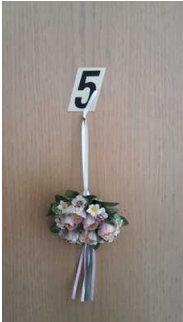
Blick auf die Beschilderung des Zimmers