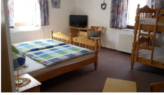
Blick in das Zimmer