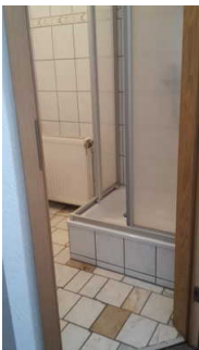
Blick auf die Dusche und den Eingangsbereich des Bades