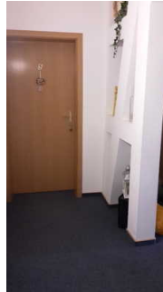
Blick auf den Eingangsbereich des Zimmers