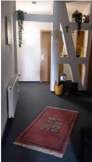
Blick auf den Weg zum Zimmer