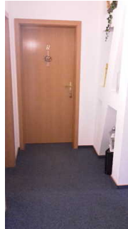
Blick auf den Eingangsbereich vor dem Zimmer