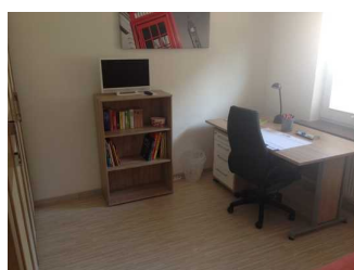
Schreibtisch und Fernseher