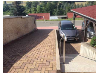
Zufahrt zum Parkplatz