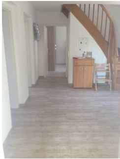
Flur zu den Zimmern im Erdgeschoss