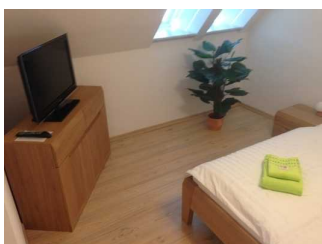
Bewegungsfläche links neben dem Bett