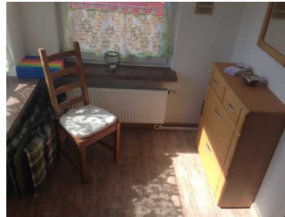
Flur im Eingangsbereich

Über den Flur / Weg / Durchgang sind zu erreichen: Arbeits- und Gästezimmer , Wohnzimmer , Küche , Separate Gästetoilette im Erdgeschoss