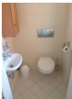
Gästetoilette im Erdgeschoss