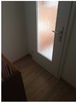
Tür zum Badezimmer