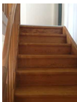
Treppe ins Obergeschoss