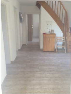
Flur zu den Zimmern im Erdgeschoss