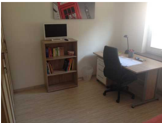
Schreibtisch und Fernseher