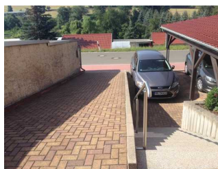
Zufahrt zum Parkplatz