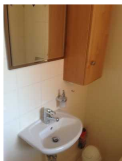
Waschbecken und Spiegel