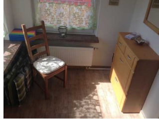
Flur im Eingangsbereich

Über den Flur / Weg / Durchgang sind zu erreichen: Arbeits- und Gästezimmer , Wohnzimmer , Küche , Separate Gästetoilette im Erdgeschoss