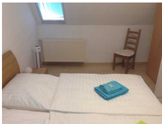
Bewegungsfläche rechts neben dem Bett