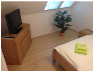
Bewegungsfläche links neben dem Bett