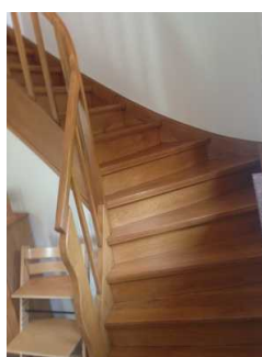
Treppe ins Obergeschoss