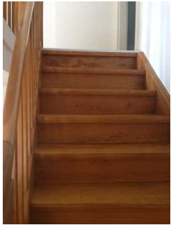
Treppe ins Obergeschoss