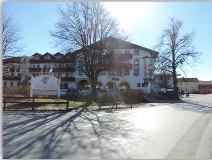
Abbildung 1: Hotel zur Post