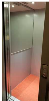
Aufzugskabine mit Spiegel