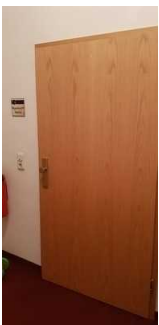
Tür zur Ferienwohnung Paris

Sanitärraum vorhanden: Sanitärraum Paris