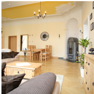
Blick in den Wohnbereich