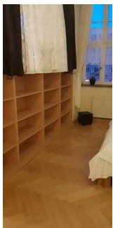
Bewegungsfläche vor dem Bett