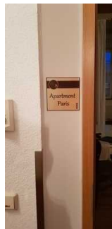
Beschilderung der Ferienwohnung