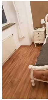
Fläche links neben dem Bett