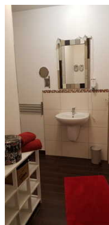
Waschbecken zugang zur Dusche