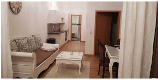
Wohnbereich der Ferienwohnung