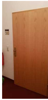
Tür zur Ferienwohnung Madrid