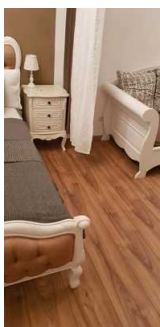
Fläche rechts neben dem Bett