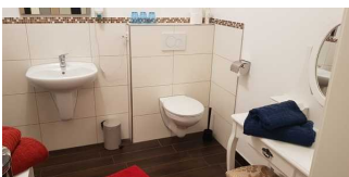
Waschbescken und Toilette