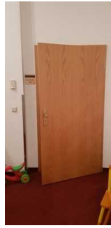
Tür zur Ferienwohnung