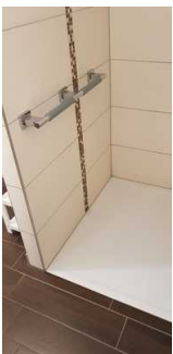
Dusche inkl Griff